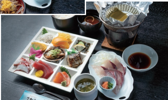
▽【11～4月限定】 鰯しゃぶ・茶碗蒸し