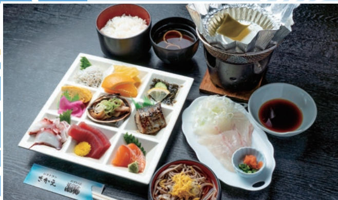
◁【5～10月限定】 鯛しゃぶ・冷やしそば