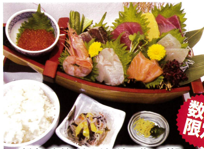
刺身・小鉢・あら汁・漬け物・ご飯