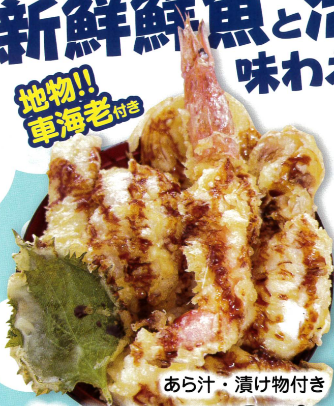
あら汁・漬け物付き